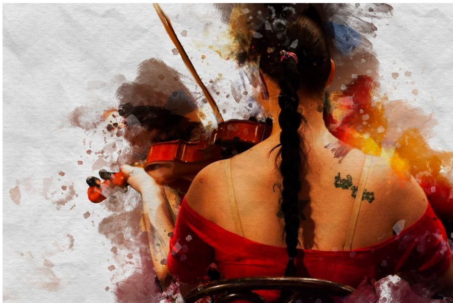
Projecte "Orquesta de cordes" desenvolupat per l'Associació Tiempos Nuevos Teatro (TNT) amb dones joves privades de llibertat del Salvador.

La conveniència d'impulsar una campanya d'educació en drets humans al voltant del binomi violències i joventuts al Triangle Nord de Centreamèrica (Guatemala, Hondures i El Salvador) i les seves derivades en les migracions internacionals, s'acorda en el marc de la Comissió de Drets Humans del Fons Català. Es veu com una oportunitat per fer visible la problemàtica del desplaçament forçós i la sol·licitud d'asil per raons de violència estructural fora de context bèl·lic. A més, aquesta campanya representa l'ocasió per aprofitar sinergies amb altres actors que treballen la mateixa temàtica, com ara la Comissió Catalana d'Ajut al Refugiat (CCAR), l'Institut Català Internacional per la Pau (ICIP), l'Escola de Cultura de Pau de la UAB, Ruido Photo, l'ONGD HUACAL o la pròpia Universitat Pompeu Fabra.