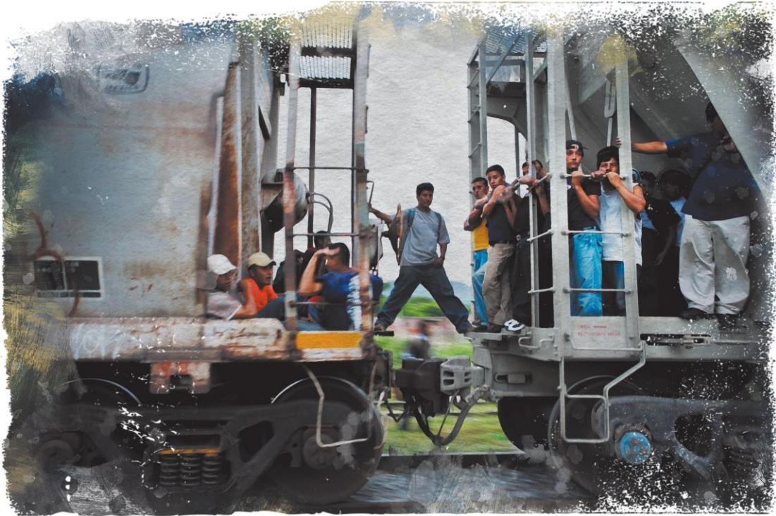
Migrants centreamericans viatgen pujats al tren de mercaderies conegut com “La Bestia” que travessa Mèxic i els apropa als Estats Units.